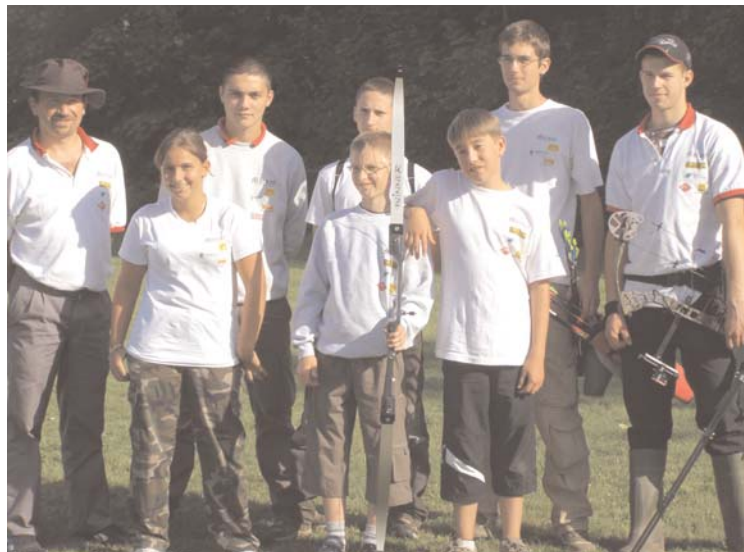
Les Archers du Val de l'Ognon

Plus d'informations sur notre site internet : tiralarc.marnay.free.fr