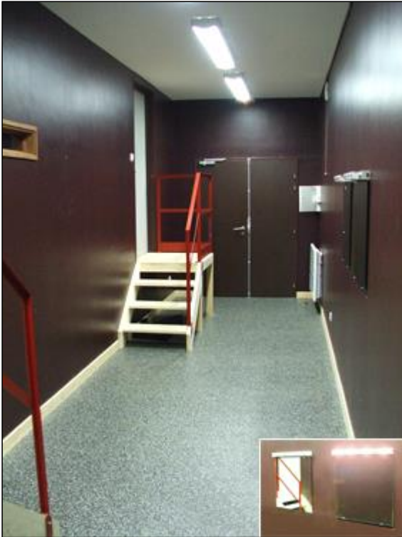
La loge de 20m2 avec accès scène – Miroirs