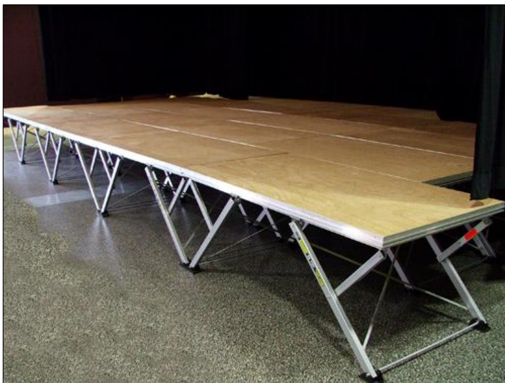
La scène modulable 9m x 5m x 0,80m