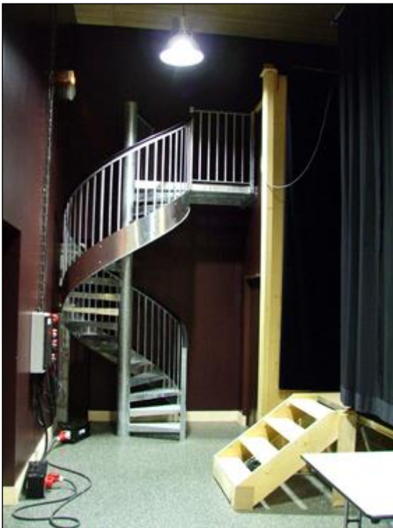
Accès étage loge par escalier colimaçon