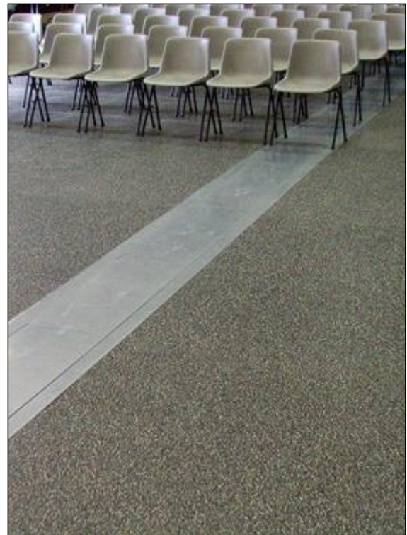
Caniveau technique pour le passage des câbles