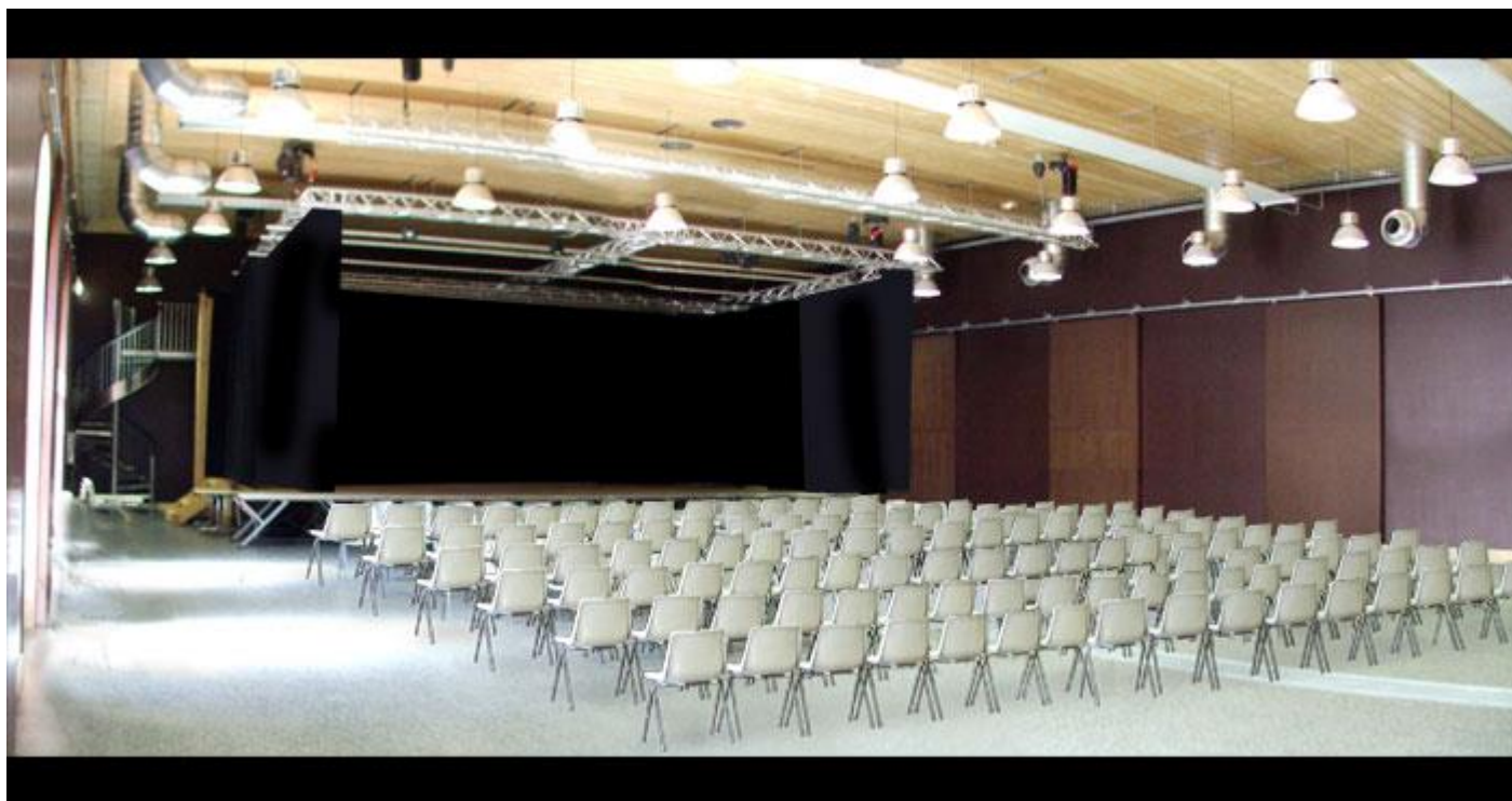
Vue globale – Capacité 399 places (hors techniciens)