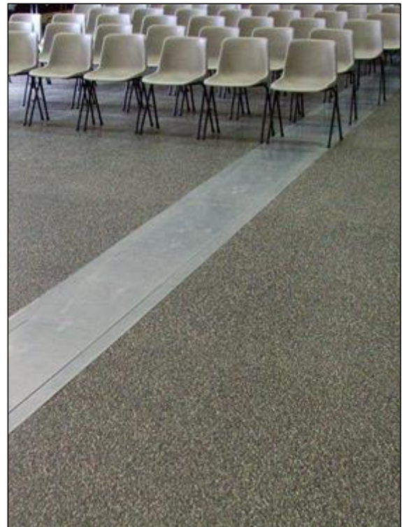
Caniveau technique pour le passage des câbles